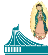
Basilica de Guadalupe